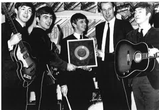
George Martin med The Beatles.

Kalendarium – i urval , exklusivt Sverigesbesök (dessa presenteras i