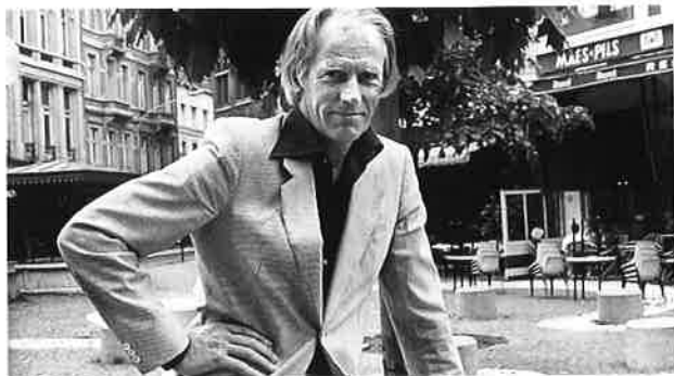
George Martin på 70-talet.