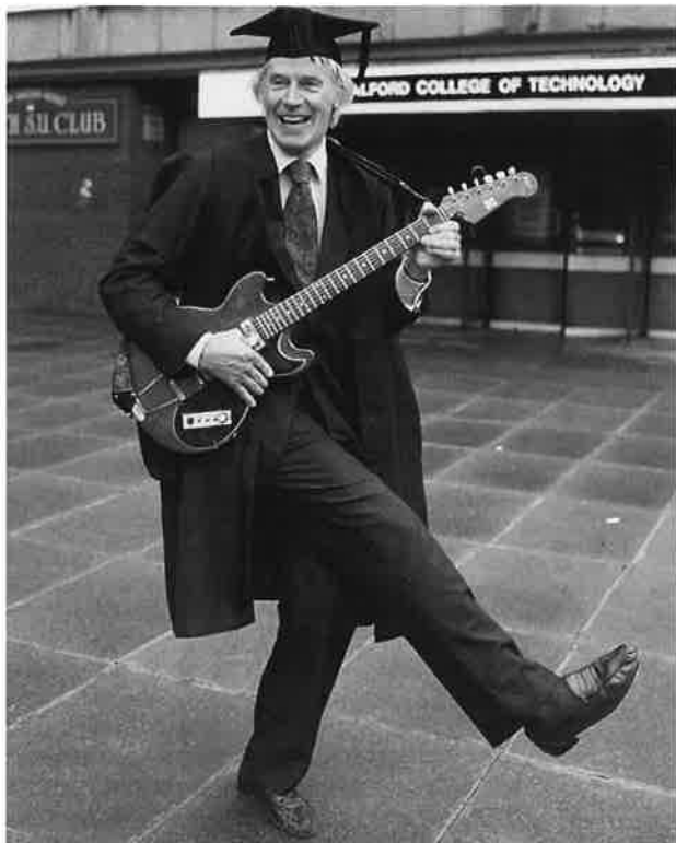
George Martin erhöill utmärkelsen Knight Bachelor 1996.