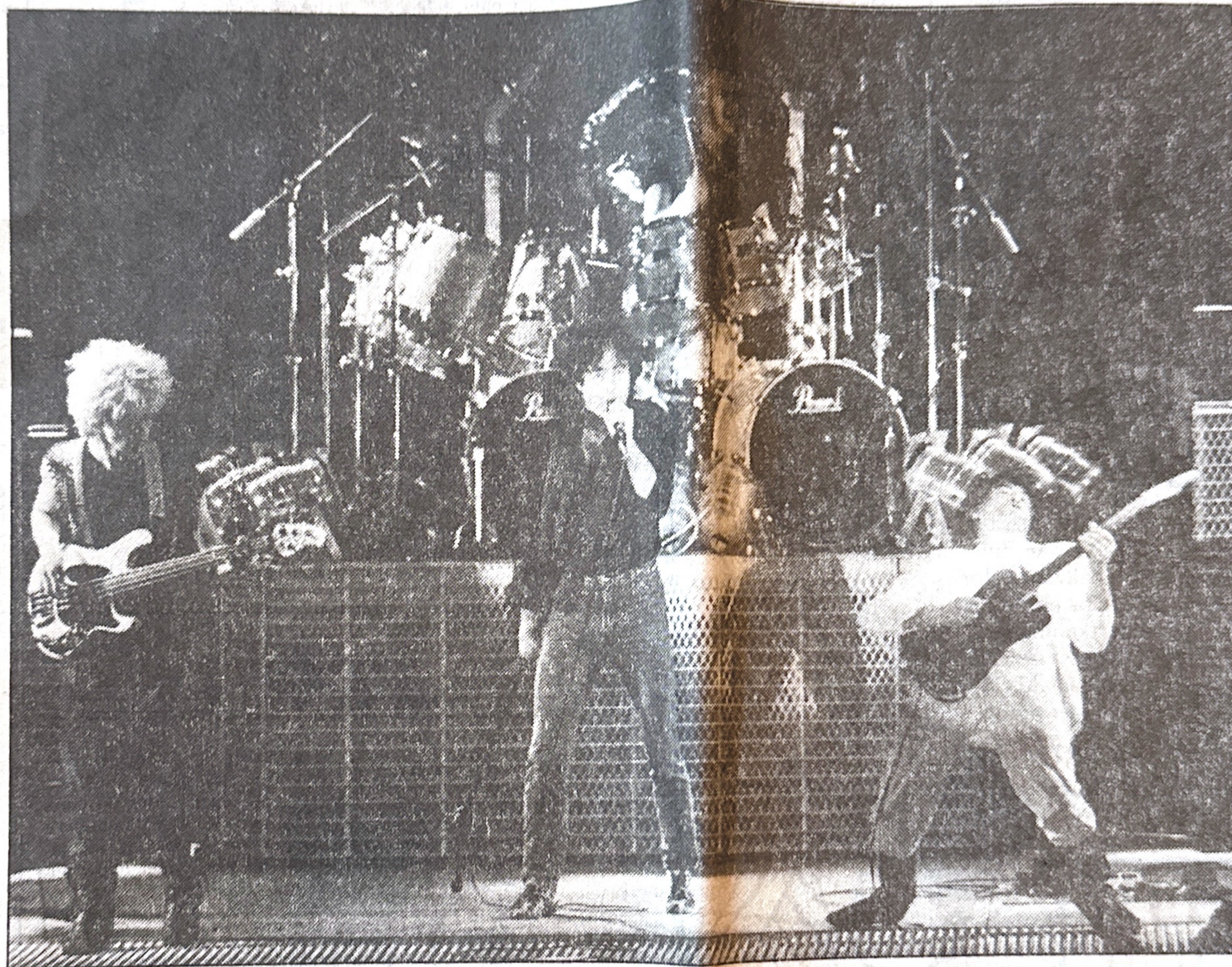
The Firm: ett spelsuget gäng veteraner som låter strålande ihop

Paul Rodgers har stått som förebild för så många rocksångare att han utan tvivel kan rankas bland de fem klassiska frontmännen. Ändå närmar han sig aldrig de machoexcesser som en efterföljare som David Coverdale vadar fram i. Rodgers bara står där med jeans, svartblå skjorta, rätt upp och ner - och låter sin röst fylla hela Olympen. Till höger om honom snurrar ett av rockens mysterium om-