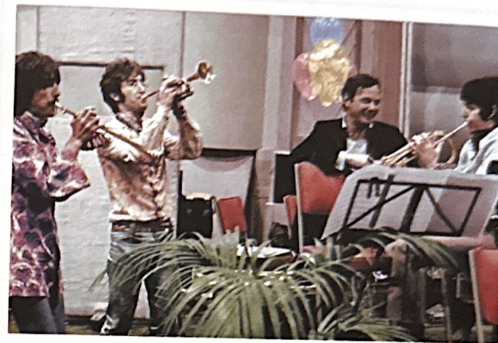
George, John och Paul lägger på blås på Sgt. Pepper medan Brian Epstein tittar på.

Paul: "It came time to play my solo, and I froze. I had sticky fingers, nothing would work. I thought, alright, no more lead. Bandets förste basist,