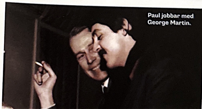
Paul jobbar med George Martin.